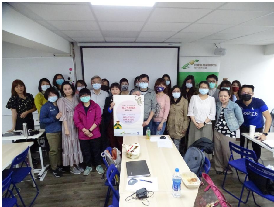
上圖：學員與 Runny 合影

Runny 的分享清晰而且實用，內容非常精彩，紮實又易懂的分享真的是讓人「秒懂懶人包」印象深刻，收穫豐富，現場互動熱烈，最後一起開心合照。今年協會的夜間課程首度與 TeSA 台灣電子商務暨創業聯誼會合辦，也請大家期待協會接下來的活動囉。